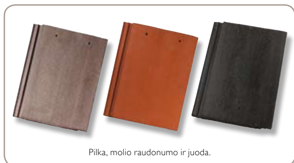
Pilka, molio raudonumo ir juoda.

MINSTER komplektą sudaro čerpės ir visi joms reikalingi priedai. Siūlome ir kitas paslaugas, kurios, pasirinkus Monier sprendimus, jums leis jaustis saugiai ir maloniai. Išsamesnės informacijos apie MINSTER čerpes ieškokite mūsų tinklalapyje www.monier.lt arba susisiekite su mūsų pardavimo ir klientų aptarnavimo skyriumi telefonu: +370 5 233 32 80.